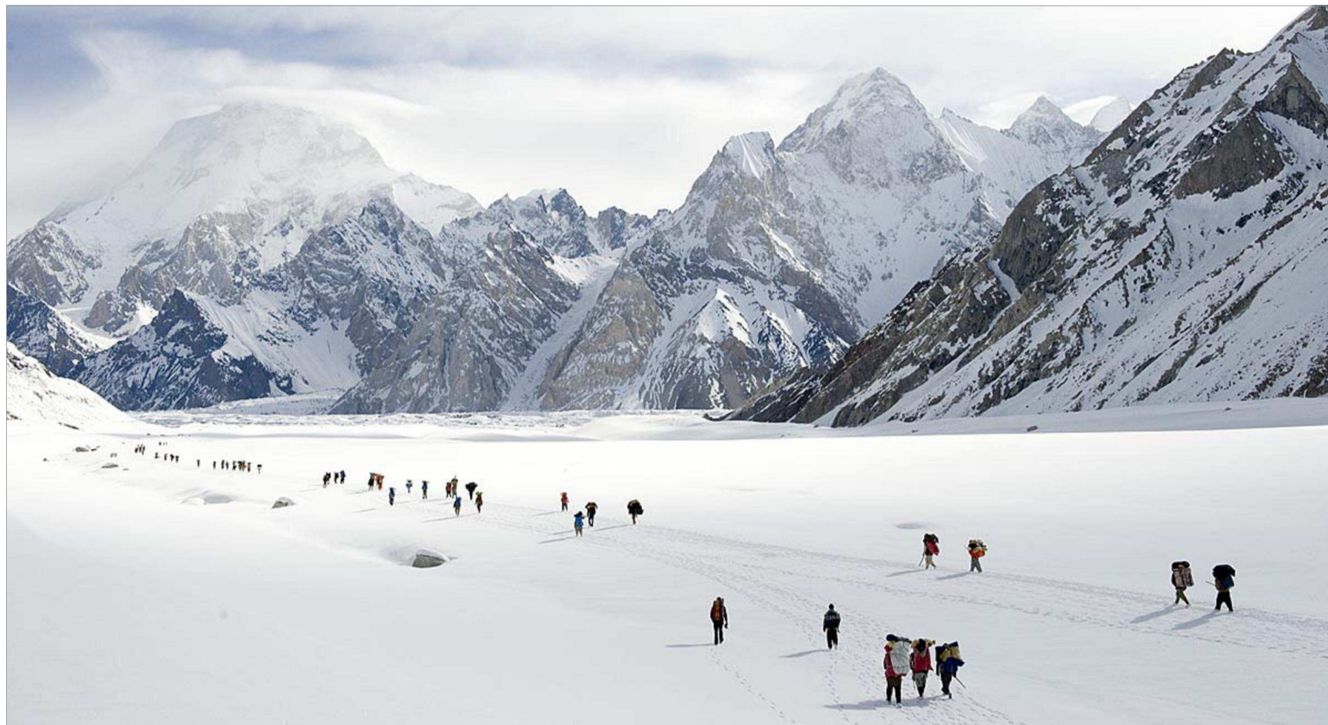
Mit bis zu 240 Lastenträgern aus Pakistan zog das internationale Expeditionsteam durch das Himalaya-Gebirge in Pakistan. Ihr Ziel: Die Region erforschen, von ihr lernen und Lösungen finden, um sie in ihrer Schönheit zu erhalten.

Alexanders Abenteuer beginnt Anfang Juli. Mit einer Profi-Ausrüstung im Wert von rund 2500 Euro bricht er mit dem Flugzeug nach Islamabad auf. Aus der ganzen Welt haben sich die Expeditionsteilnehmer hier versammelt; darunter u. a. Jugendliche aus Singapur, Australien und Frankreich, Mike Horn, der schweizer Extremabenteurer Koby Reichen sowie zwei französische Bergführer. Sie alle kommen aus den unterschiedlichsten Ländern der Erde und haben doch drei gemeinsame Ziele. Sie wollen die Region erforschen, von der